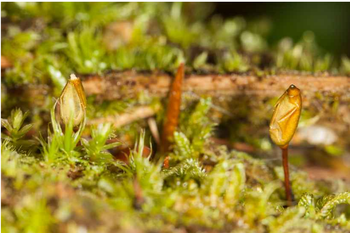
Abb. 3. Während der Sporenreife werden die Kapseln von Buxbaumia viridis braun und die Epidermis löst sich teilweise ab.

Zudem produziert die Art Gemmen am Protonema (Wolf 2015), die der vegetativen Vermehrung dienen und mit der sie trockenere Perioden überdauern kann (Korsch 2020).