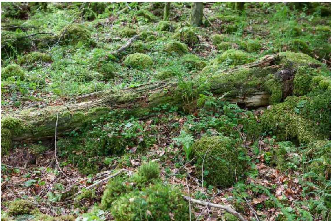
Abb. 2. Von Buxbaumia viridis besiedelter morscher Fichtenstamm im Odenwald