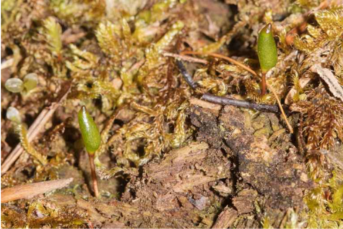
Abb. 1. Zwei Kapseln von Buxbaumia viridis im Kellerwald.